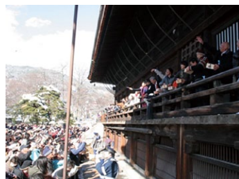
信州・善光寺の豆まき http://www.city.nagano.nagano.jp/site/fotnews/48155.html

節分(立春、2月4日頃)に、鬼に豆をぶつけ、一年の無病息災を願う風習が古くからあります。室町時代に始まったと言われます。お祓いで清めてから炒った大豆(炒り豆)が正式とされます。現在、スーパーなどでは福豆(ふくまめ)として売られています。落花生を撒いたり(北海道、東北、北陸、南九州)、また、「鬼は内」の掛け声でまく地域もあります。多くの社寺で、年中行事になっています。年齢(数え年)の数だけ拾って食べるのが普通。風邪を引かないように、年齢より1つ多く食べる地域もあります。